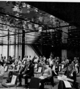
Der Vortragsraum im Melia Hotel in Wien – Österreichische Apothekerkammer