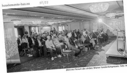
Blick ins Plenum des dritten Wiener Fensterkongresses.